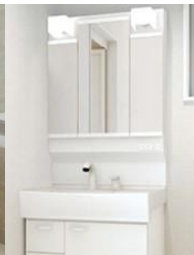
洗面化粧台 Housetec QV

お得な 水廻り4点 まるごとパック (工事費込完成パック) 110.0万円(税抜)