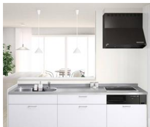
システムキッチン Housetec LE

※工事費はUB入替の場合 商品代 ⑧897,000円が 345,000円 + 基本工事費 280,000円 ⇓ 工事費込 完成パック 62.5万円(税抜)