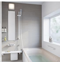
システムバス Housetec フェリテ