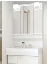
洗面化粧台 Housetec QV

お得な 水廻り4点 まるごとパック (工事費込完成パック) 110.0万円(税抜)