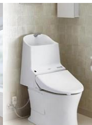
トイレ TOTO HV